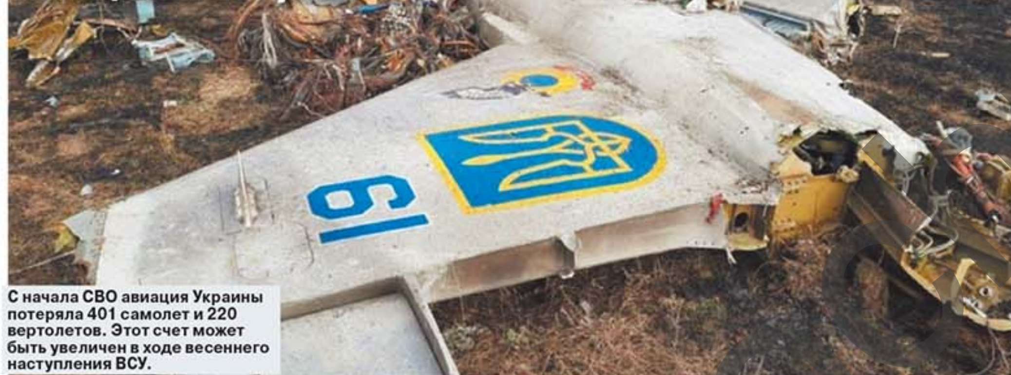
С начала СВО авиация Украины потеряла 401 самолет и 220 вертолетов. Этот счет может быть увеличен в ходе весеннего наступления ВСУ.

В преддверии весеннего наступления ВСУ Киев приступил к переброске на Запорожское направление своей боевой авиации. Точнее, не своей, а западной.